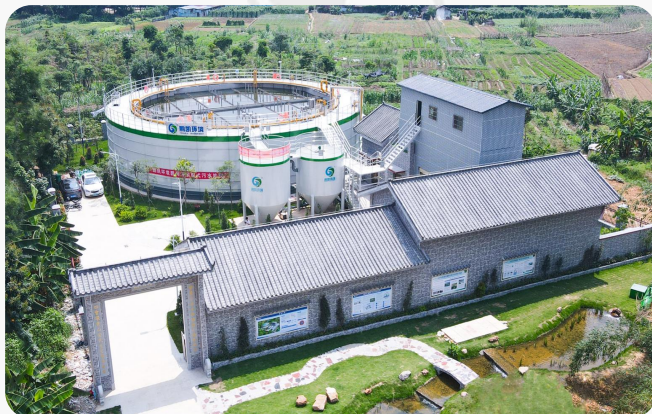
肇庆四会市碧海湾污水处理站项目 处理水量：10000T/D 处理工艺：DIAB工艺