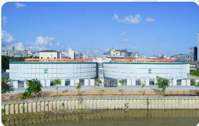
潮州市枫江流域水环境综合治理项目 处理水量：35000T/D 处理工艺：DIAB工艺