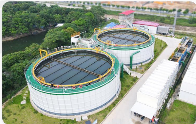
珠海市高新区装配式污水处理厂项目 处理水量：20000T/D 处理工艺：DIAB工艺