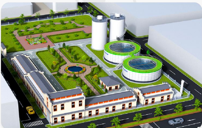
贵州远明中厚酒业污水处理设备采购项目 处理水量: 300T/D 处理工艺: DIAB工艺