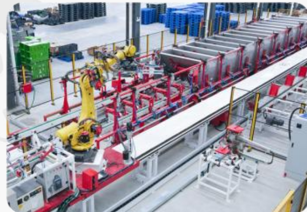
航拍视频：装配式污水处理系统工业4.0生产基地