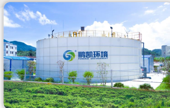
惠州大亚湾石头河宝山支流污水处理项目 总处理水量：2000T/D 处理工艺：DIAB工艺