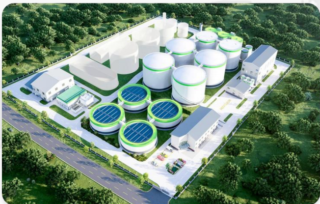
贵州余庆县河东综合片区(白泥产业园)污水处理厂项目 处理水量: 3000T/D 处理工艺: DIAB工艺