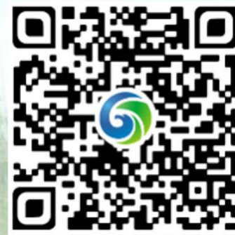
鹏凯环境 微信公众号