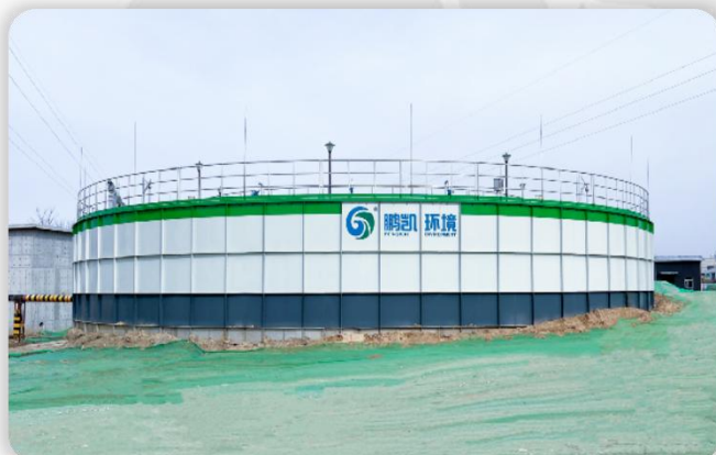
陕西渭南市华阴市污水处理厂提标扩容改造项目 处理水量：5000T/D 处理工艺：DIAB工艺