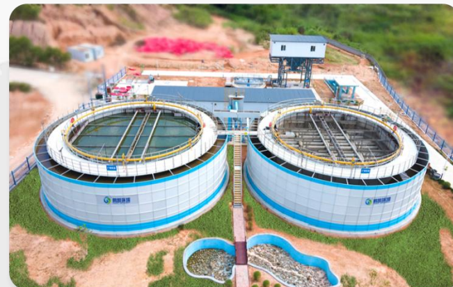
肇庆市德庆县PPP生活污水处理项目 处理水量：15500T/D 处理工艺：DIAB工艺