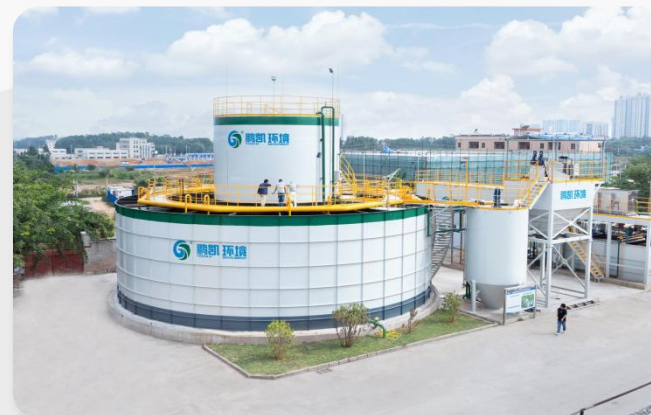
茂名新洲海产有限公司生产(屠宰)废水处理项目 处理水量: 1000T/D 处理工艺: DIAB工艺