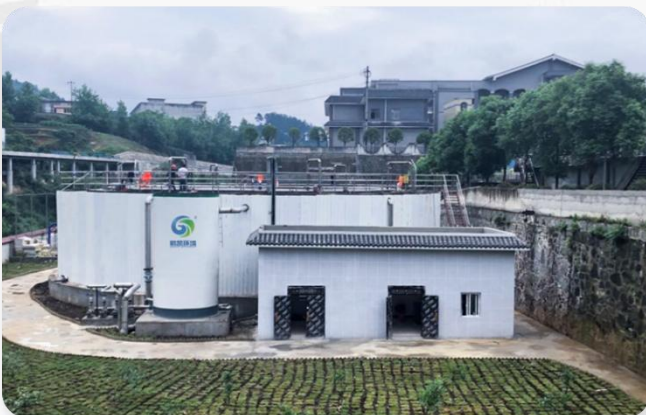
贵州苍龙片区白酒废水处理厂改造工程项目 处理水量: 2000T/D 处理工艺: DIAB工艺