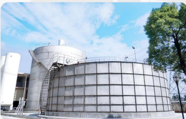
天地壹号饮料股份有限公司金桐厂污水处理系统 处理水量: 1800T/D 处理工艺: DIAB工艺